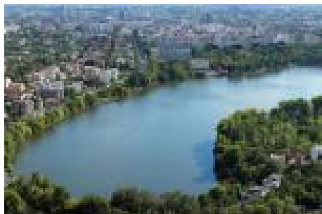
Vedere etaj superior Floreasca Residence