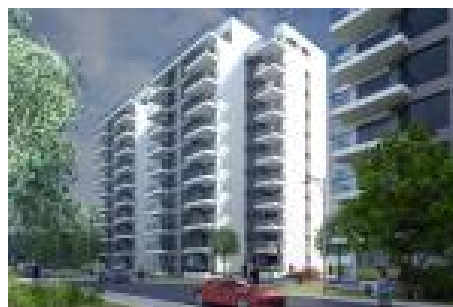
Imagine clădiri Floreasca Residence